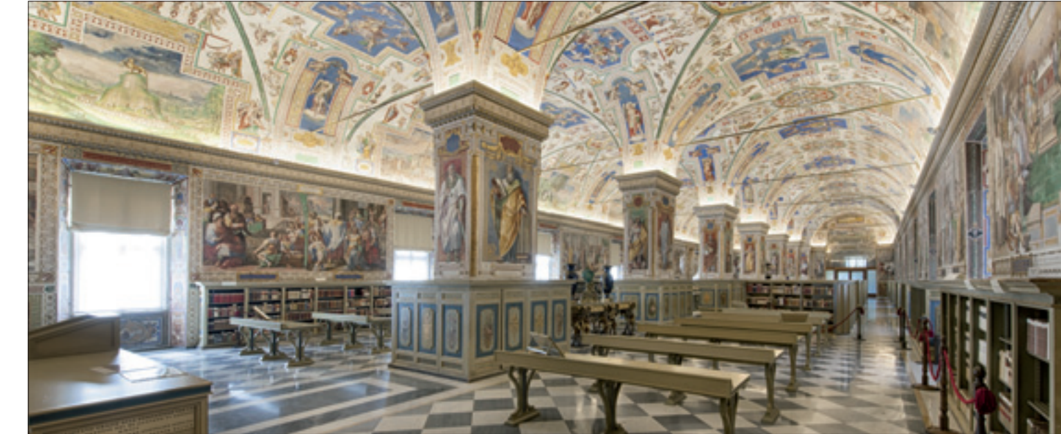
El salón séxtimo de la Biblioteca vaticana

Ya he definido proyectos. El proyecto es aprender. Cuando se llega a un lugar, a un lugar que no