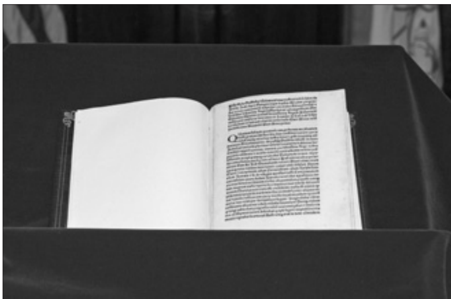
El incunable original